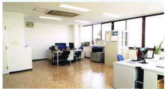
Lúc nào cũng có giáo viên nhiệt tình, có thể trao đổi lúc nào cũng được