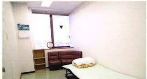
Lúc cơ thể mệt mỏi, các bạn có nơi yên tĩnh để nghỉ ngơi