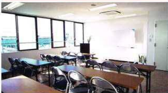
Phòng học rộng, sáng sủa, có điều hòa